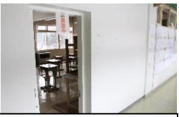
空き教室の温風で廊 下温度を上げる工夫

寒さが厳しくなる中、生徒たちが快適に過ごせるよう、今年も廊下の寒さ対策として公務補さんに渡り廊下や3線廊下の窓にビニールを張っていただき、寒さ対策を実施しています。さらに今年は、一部の教室の扉を開放して、廊下の温度を上げる工夫をしています。関係機関の御協力で、生徒玄関にはストーブも設置できました。今後も、生徒たちが元気に学校生活を送れるよう、様々な対策を進めていきたいと考えています。