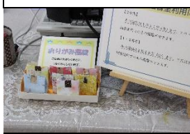
折り紙福袋早い者勝ち

図書館司書の■■■さんが企画してくれた「お菓子作りの本」展では、おいしそうなスイーツが作れそうな本がたくさん並んでいます。