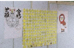
3階多目的室前に掲示さ れた応援メッセージ

2学期から、生徒会が中心となって、3年生の合格を祈願した掲示物の作成に取り組んできました。生徒会役員は、心を込めてカードの準備やデザインを考え、1・2年生や先生方から集まった応援メッセージを、合格祈願のだるまや鷲の絵を組み合わせて力強い掲示物に仕上げました。始業式で披露され、3年生の皆さんにとって受験の励みになったと思います。3階多目的室前に掲示されています。ぜひご覧ください。