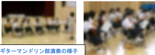
ギターマンドリン部演奏の様子

ひなわしメート（鷺別地区放課後子ども教室 [ ]さん）から声を掛けていただき、鷺別小学校の体育館で演奏を行ってきました。日頃の練習成果を発揮する貴重な機会になりました。ひなわしメートの皆さん一人一人が、目を輝かせて聴いてくれていた姿を微笑ましく感じた時間でした。