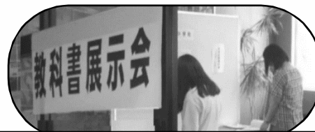
本年度の教科書の展示を見る市民(6/23)