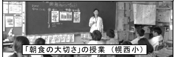
「朝食の大切さ」の授業（幌西小）

教育委員会の学校教育グループと連携して各小学校に栄養教諭を派遣し、子どもたちに栄養バランスや生活リズムの大切さ等を伝える「食育の授業」を実施しています。