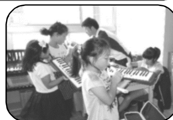
楽しい休み時間（幌別西小）

小中学校ともに「いじめが発生してからでは遅い。」という認識の下、未然防止に力を入れた「いじめをなくすための啓発活動」や「望ましい人間関係の育成」を中心に、全校をあげてその根絶のための取組を進めています。