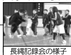
長縄記録会の様子