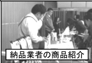
納品業者の商品紹介

学校給食展は、地場産品を活用した特別メニューの提供や、納品業者による商品の紹介などを通し、多くの皆さんに学校給食に対する理解を深めていただくために実施しています。