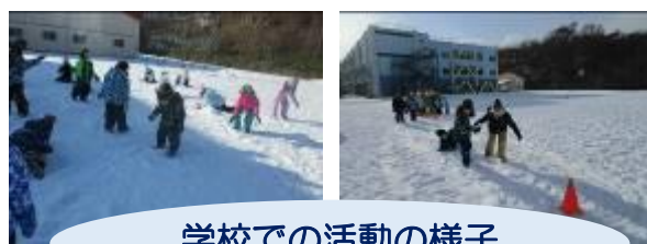
学校での活動の様子

5・6年生は、1月31日に「スキー授業」を行う予定です。寒さ対策はもちろんですが、持ち物も多くありますので、忘れ物などのないよう準備のほど、よろしくお願いします。