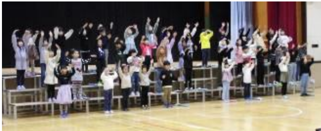
【1年生：はじめての学習発表会～元気いっぱいに発表しました！】

子どもたちは、この日のために、今まで学習してきた歌や器楽を中心に、一生懸命練習に励んできました。途中、暴風雨による臨時休業、インフルエンザによる学級閉鎖、風邪等による欠席者の急増などで、思うように練習が進まない中での開催でしたが、先生方の臨機応変な対応力と子どもたちの適応力のおかげで、実りのある学習発表会となりました。発表後の子どもたちの表情にも達成感や満足感があふれ、どの学年の子も今までの練習の成果を発揮することができたと思います。