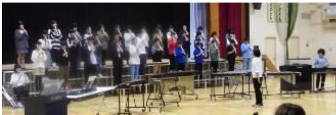
【6年生：最後の学習発表会～実行委員会を組織し、自分たちで！】

今回の学習発表会の取組を通して、子どもたちは、粘り強く責任をもって取り組む力やみんなと協力して取り組む力（6年生は自分たちで計画・運営する力）などを伸ばすことができたと思います。ご家庭におかれましても、お子さんの頑張ったところや成長したところをしっかりと捉えて、褒めてほしいと思います。